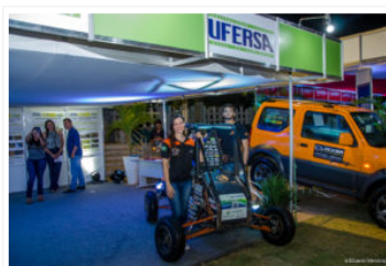
O Projeto Cactus Baja, dos estudantes de engenharia, é uma das atrações do estande

Durante os dias da Expofruit acontece ainda as clínicas tecnológicas com abordagens voltadas para a produção de várias culturas como: uva, cajarana, pera e maçã, cacau, pitaya, maracujá, abacaxi e produção de comidas a base de caju. E nesta quarta-feira, 22, a partir das 14 horas, no Auditório da Reitoria da Ufersa, acontece o Seminário Fruticultura: Negócio, Inovação e Estratégia.