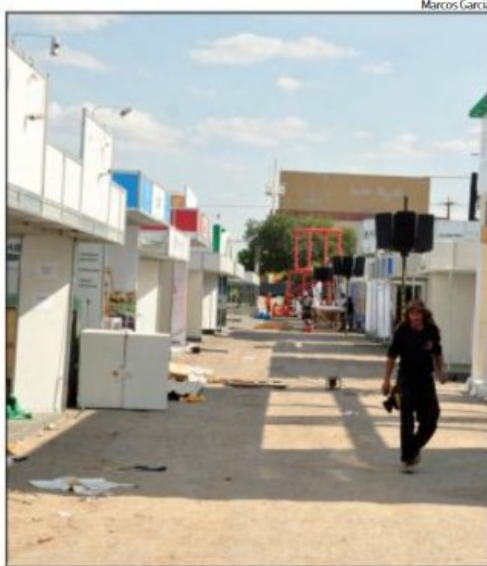
Evento conta com uma extensa programação

Às 8h, no escritório do Sebrae, tem sequência o Curso de Habilitação para Certificação Fitossanitária de Origem e Certificação Fitossanitária de Origem Consolidada (CFO/CFOC). Das 8h às 12h, também no Sebrae, serão realizadas as clínicas tecnológicas, que abordarão a produção de