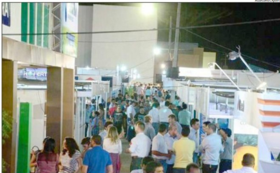
Mais de 90% dos estandes da Feira Internacional de Fruticultura Tropical Irrigada já foram comercializados