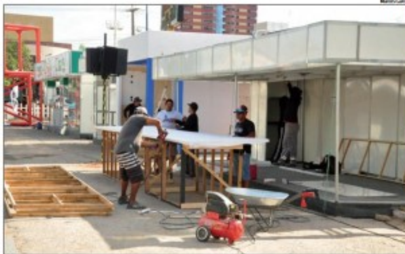
Montagem dos estandes está sendo finalizada na Estação das Artes

A Expofruit 2018, promovida pela Promoxpo em parceria entre o Comitê Es-