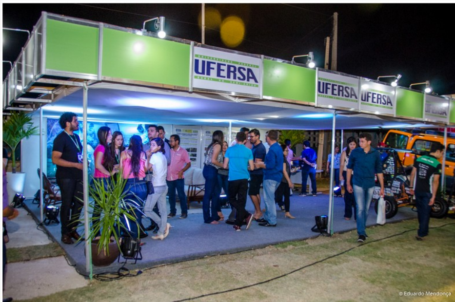
No estande da Ufersa os visitantes poderão conhecer um pouco sobre as atividades de ensino, pesquisa e extensão desenvolvidas pela Universidade

Evento, Extensão 22 de agosto de 2018. Visualizações: 546. Última modificação: 22/08/2018 09:26:16