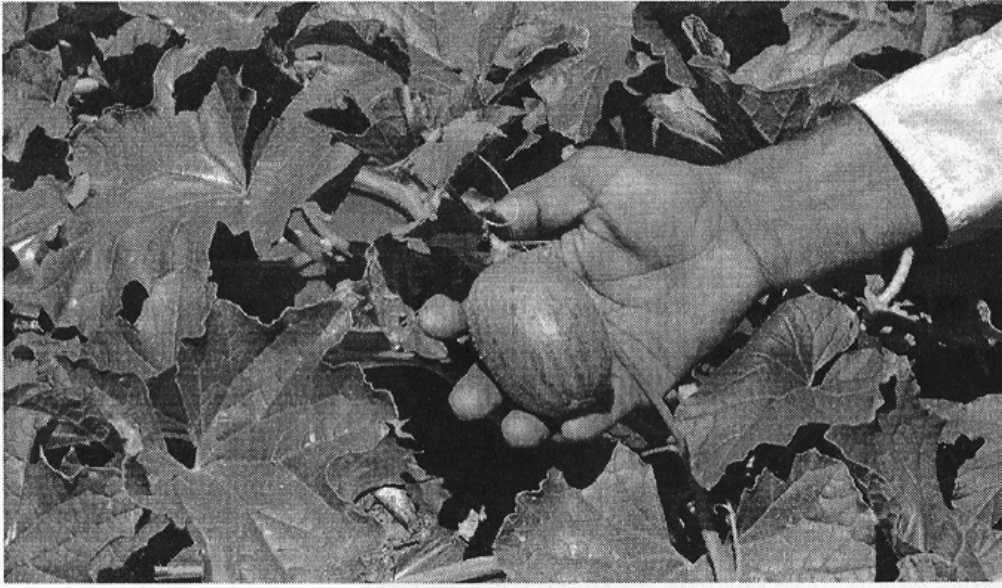
Experiências das vinícolas do RS servirão de base às ações desenvolvidas na produção de melão no RN