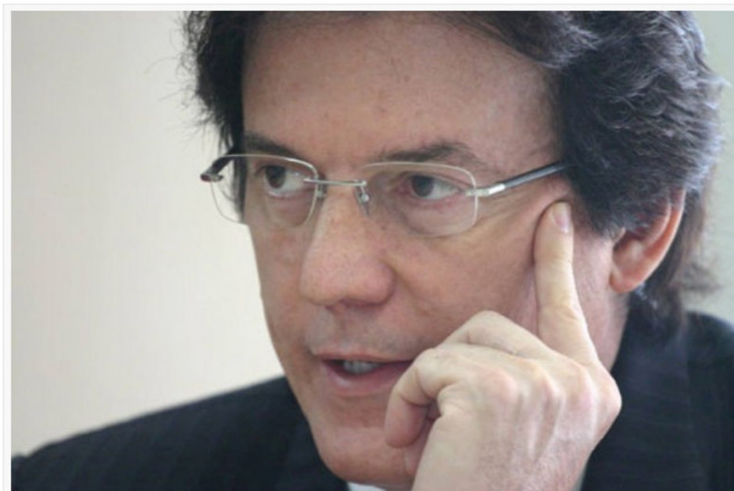
Robinson é o primeiro convidado das classes produtivas de Mossoró e região

Entidades representativas da classe produtiva de Mossoró e região, reúnem-se hoje a partir do meio-dia com o candidato a governador pela Coligação Liderados pelo Povo, vice-governador Robinson Faria (PSD). Será no restaurante Tenda Gastronomia - em Mossoró.