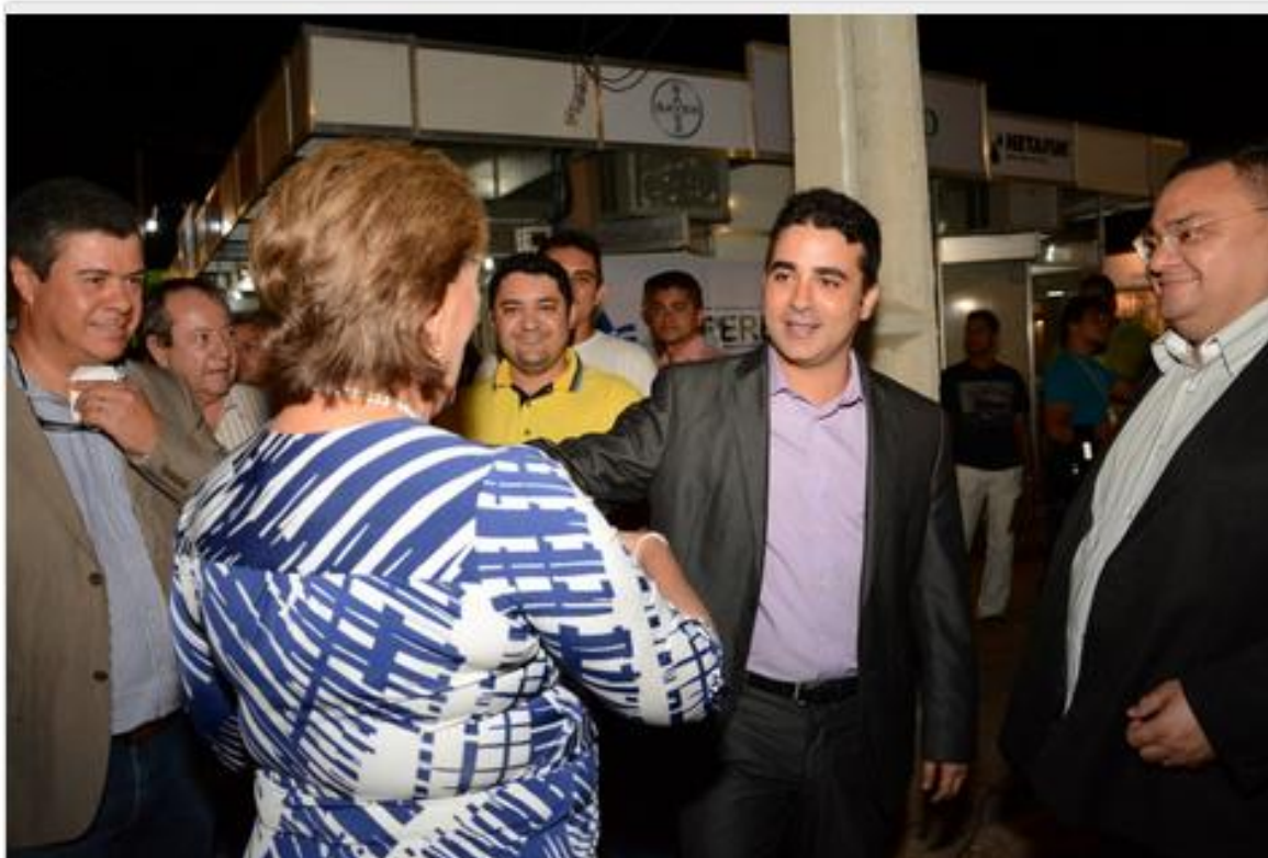
Expofruit 2014 é aberta com participação de autoridades de Mossoró e do Estado

Governadora Rosalba Ciarlini e prefeito Francisco José Júnior participaram de solenidade