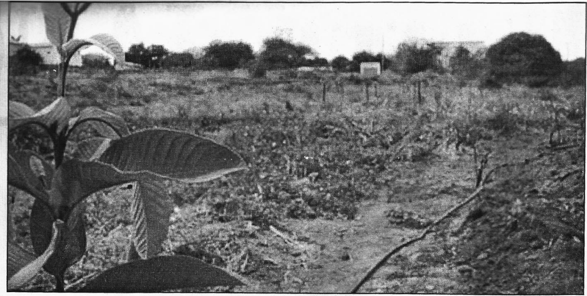
Ufersa prepara pomar há quatro anos e pretende ampliar projeto de visitas à área de cultivo