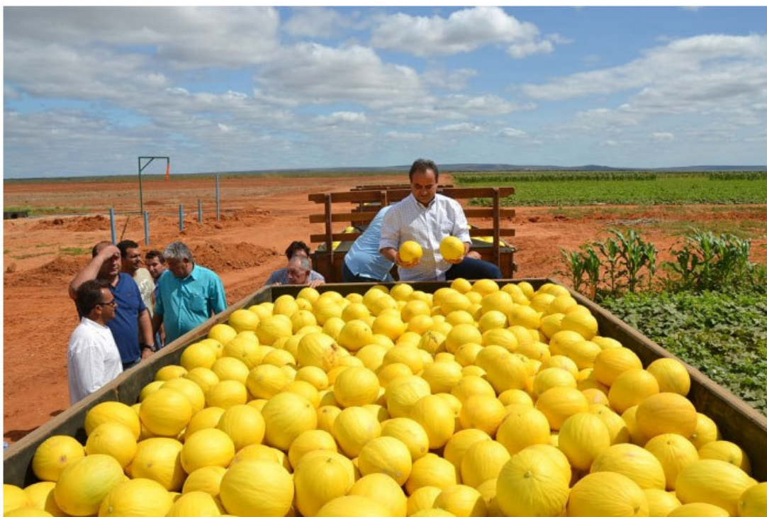
Melão é o campeão da exportação entre as frutas potiguares